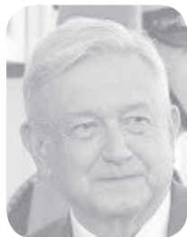
Andrés López Obrador

La duda aquí es si en las demás entidades autorizarán la apertura de los estadios y, de no ser así, ¿cuál será el plan? Porque es innegable que miles de aficionados están que brincan por ir a los estadios como ocurre año con año, sin embargo, las aglomeraciones de gente pondrán en riesgo la salud con un posible rebrote de la pandemia, que nos ha