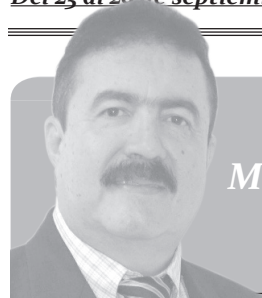
Columna de Miguel Ángel Vega C.