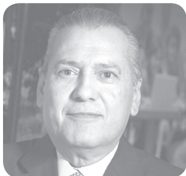
Manlio Fabio Beltrones