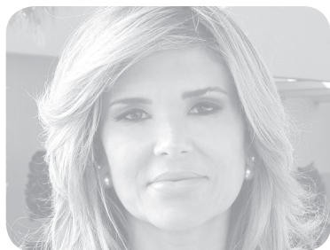
Claudia Pavlovich Arellano