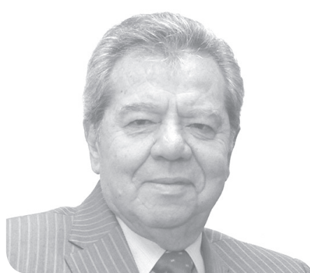
Porfirio Muñoz Ledo